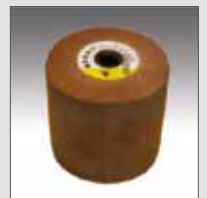
KWF in tessuto non tessuto super duty