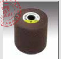
KWF in tessuto non tessuto siavlies