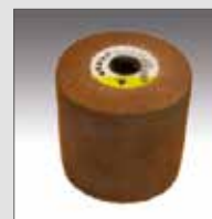
KWF in tessuto non tessuto super duty