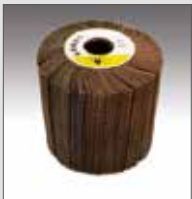
KWF in tela