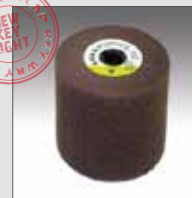
KWF in tessuto non tessuto siavlies