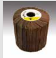
KWF in tela