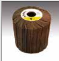
KWF in tela